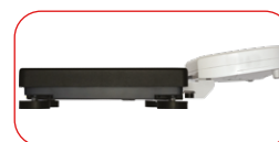
Ultra piatta con piedini regolabili