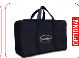
Borsa universale imbottita per un facile trasporto