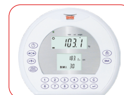
Visore a tripla lettura Peso Altezza BMI