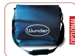
Borsa tracolla imbottita per un facile trasporto