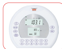
Visore a tripla lettura Peso Altezza BMI