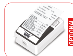
Stampante termica per peso e indice massa corporea