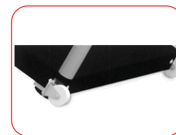
Ruote per semplice trasporto