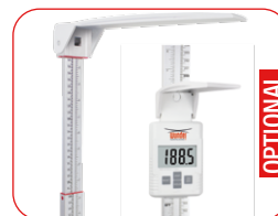
Statimetro telescopico manuale: Letture digitale o serigrafata